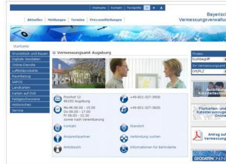
Abbildung: Startseite www.vermessungsamt-augsburg.de

Mit der vollständigen Neugestaltung der Internetpräsenz der Bayerischen Vermessungsverwaltung zeigt sich auch das Vermessungsamt Augsburg in neuem Outfit.