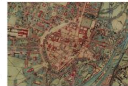
Bild unten: Historische Karten aus dem 19. Jahrhundert zeigen die Entwicklung von Städten und Landschaften

Nähere Informationen finden Sie auf der Internetseite der Bayerischen Vermessungsverwaltung: