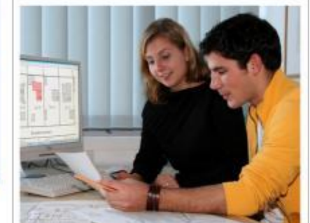
Das Vermessungsamt Augsburg sucht Nachwuchskräfte im Beruf Katastertechnik

Schwerbehinderte Bewerberinnen und Bewerber werden bei gleicher Eignung vorrangig berücksichtigt. Der Freistaat Bayern fördert die berufliche Gleichstellung von Frauen und Männern und begrüßt daher die Bewerbung von Frauen besonders.