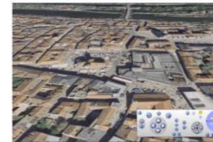
Bild oben: 3D-Flüge über die geplante Route können mit den TopMaps Bayern eingeblenkt werden.

Ohne Top10/Top50 (ab Version 4) geht's nicht. Die Installation der Top10/Top50 ist unbedingt erforderlich.