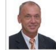
Sehr geehrte Kunden und Partner!

Die Bayerische Vermessungsverwaltung hat seit dem 3. Juli 2009 einen grundlegend neugestalteten Internetauftritt. Die neuen Internetseiten sind zeitgemäß und übersichtlich gestaltet. Besonders stolz macht es mich, dass das Serviceteam Internet/Intranet des Vermessungsamts Augsburg maßgeblich an der Entwicklung des modernen Internetauftritts mitgewirkt hat. Überzeugen Sie sich selbst im Internet von der intuitiven Bedienbarkeit der ansprechend und attraktiv gestalteten Seiten.